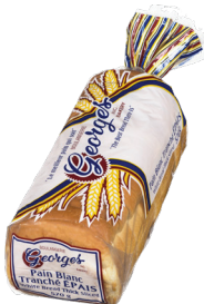
Pain blanc tranché épais