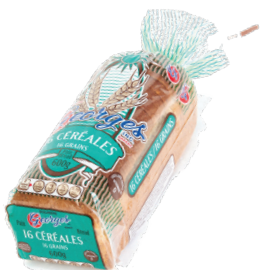
Pain 16 céréales